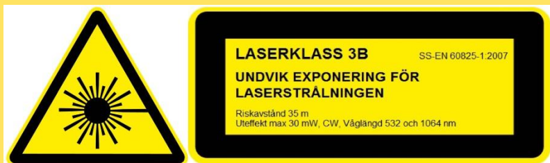
Figur 2: Exempel på märkning med säkerhetsinformation.